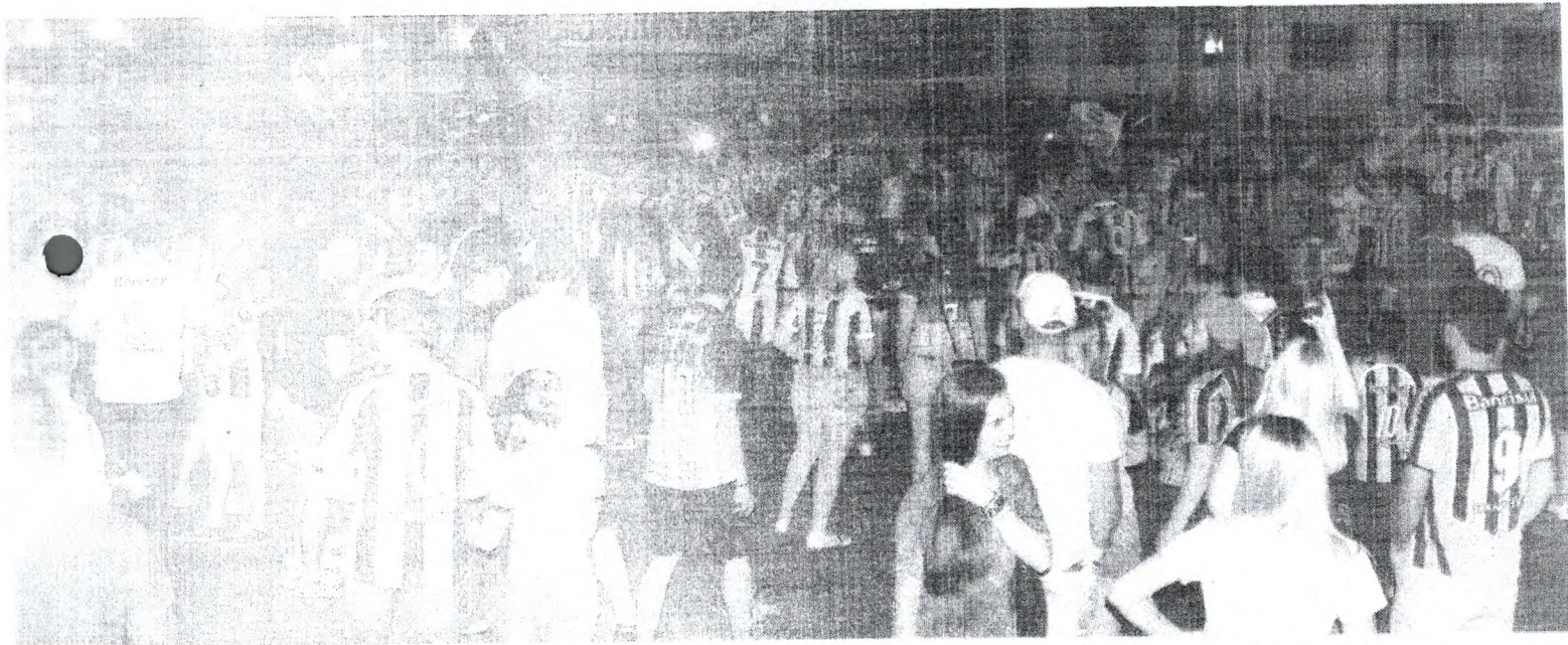
Grêmio conquistou a Libertadores da América, o terceiro título do clube na competição. O tricolor gaúcho assegurou a vitória ao vencer por 2 a 1 o segundo jogo da final, contra o Lanús. Em Pato Branco, houve comemoração nas ruas. Pág. 23